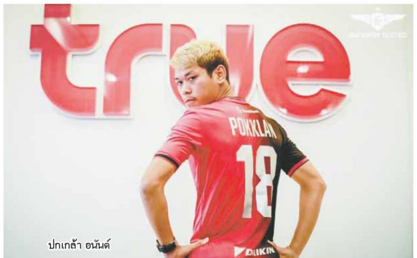
ปกเกล้า อนันต์

สวนกุหลาบวิทยาลัย โดย พาทีม "ชมพู่ฟ้า" คว้ามแชมป์ ระดับชาล้นมากมาย ก่อนจะ ได้ท้าแข่งฟุตบอลซีพีกับ ทีมไทยฮอนด้า สโมสรชื่อดัง