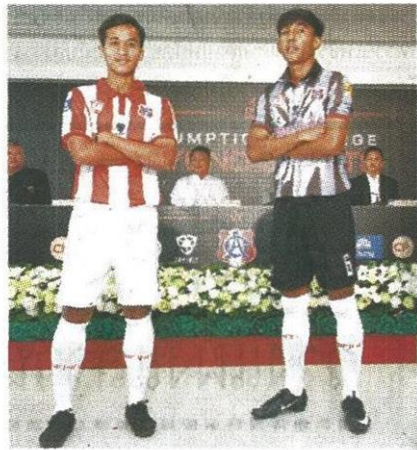
เสื้อแข่งชั้นของ "อินทรีแดง" ในแบรนดิอินฟินิตสปอร์ต

UNITY (ยูนิตี) คือ ความสามัคคีเป็นหนึ่งเดียวกัน FAMILY (แฟมิลี่) คือ ความเป็นครอบครัว ทั้งนักกีฬา ผู้ฝึกสอน ผู้ปกครอง ศิษย์เก่า รวมไปถึงทุกท่านที่เป็นหนึ่งในการสนับสนุนโรงเรียนอัสสัมชัญด้วย SPIRIT (สปิริต) คือ ความมีน้ำใจเป็นนักกีฬา รู้แพ้ รู้ชนะ รู้อภัย ทั้งในสนามและนอกสนาม การให้เกียรติเพื่อนร่วมทีม และเพื่อนต่างทีม