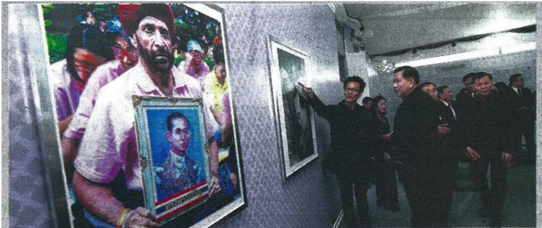
พล.อ.ธนะศักดิ์ ปฏิมาประกร รองนายกรัฐมนตรี เปิดนิทรรศการ "ทรงสถิตในดวงใจไทยนิรันดร์" ที่พิพิธภัณฑ์สถานแห่งชาติ กรุงเทพฯ

หัวข้อข่าว: พล.อ.ธนะศักดิ์ ปฏิมาประกร รองนายกรัฐมนตรี เปิดนิทรรศการ "ทรงสถิตในดวงใจไทยนิรันดร์" ที่พิพิธภัณฑ์สถานแห่งชาติ กรุงเทพฯ