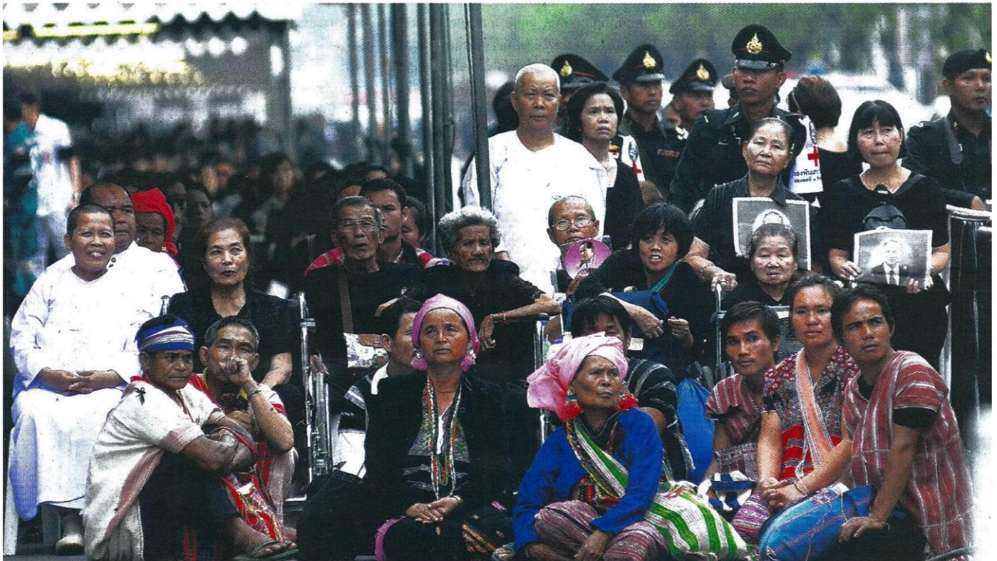
ประชาชนจำนวนมากเข้าคิวรอตั้งแต่เช้ามืดเพื่อร่วมลงนามแสดงความอาลัย ซึ่งสำนักพระราชวังเปิดให้ลงนามเป็นวันสุดท้าย เมื่อวันที่ 28 ค.ค.

และดำเนินพระบรมราชาบาย ขยายผลแห่งพระราชกรณียกิจเพื่อบำบัดทุกข์ให้ปวงชนทุกฝ่ายจากแผ่นดิน พระบาทสมเด็จพระปรมินทรมหาภูมิพลอดุลยเดชทรงบริบูรณ์ด้วยพระปัญญาคุณ พระบริสุทธิคุณ และพระกรุณาธิคุณ พระราชกิจที่ทรงบำเพ็ญให้เป็นไปนั้น ปราศจากมลพิษ ทรงมุ่งหมายประโยชน์ใหญ่ของส่วนรวมเป็นสำคัญ มิใช่เพื่อลาภ ยศ สรรเสริญ สุขของส่วนพระองค์ ทรงยอมสละทุกสิ่งทุกอย่างได้เพียงประโยชน์สุขของพสกนิกร