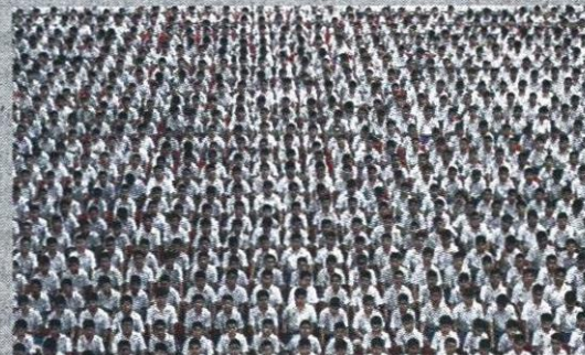
นักเรียนโรงเรียนอัสสัมชัญ ร่วมใจแปรอักษรเพื่อน้อมรำลึกในพระมหากรุณาธิคุณ