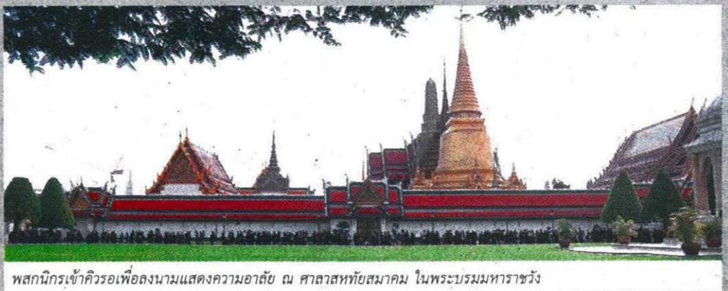
พลสกนิกรเข้าคิวรอเพื่อลงนามแสดงความอาลัย ณ ศาลาสหทัยสมาคม ในพระบรมมหาราชวัง