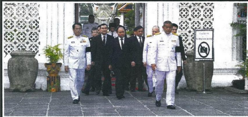
■ แสดงความอาลัย ■ นายเหวียน ชวน ฟุก นายกรัฐมนตรีสาธารณรัฐสังคมนิยมเวียดนาม มาลงนามแสดงความอาลัย พระบาทสมเด็จพระปรมินทรมหาภูมิพลอดุลยเดช ที่พระที่นั่งดุสิตมหาปราสาท ในพระบรมมหาราชวัง เมื่อวันที่ 28 ต.ค.