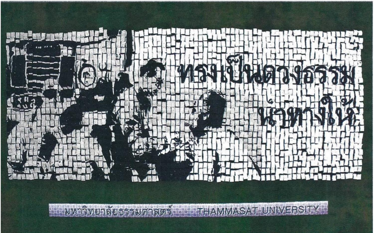
ศิษย์เก่าและศิษย์ปัจจุบันของมหาวิทยาลัยธรรมศาสตร์ร่วมกันแปรอักษร เพื่อน้อมรำลึกถึงพระมหากรุณาธิคุณของพระบาทสมเด็จพระปรมินทรมหาภูมิพลอดุลยเดช ที่สนามฟุตบอลมหาวิทยาลัยธรรมศาสตร์ ท่าพระจันทร์