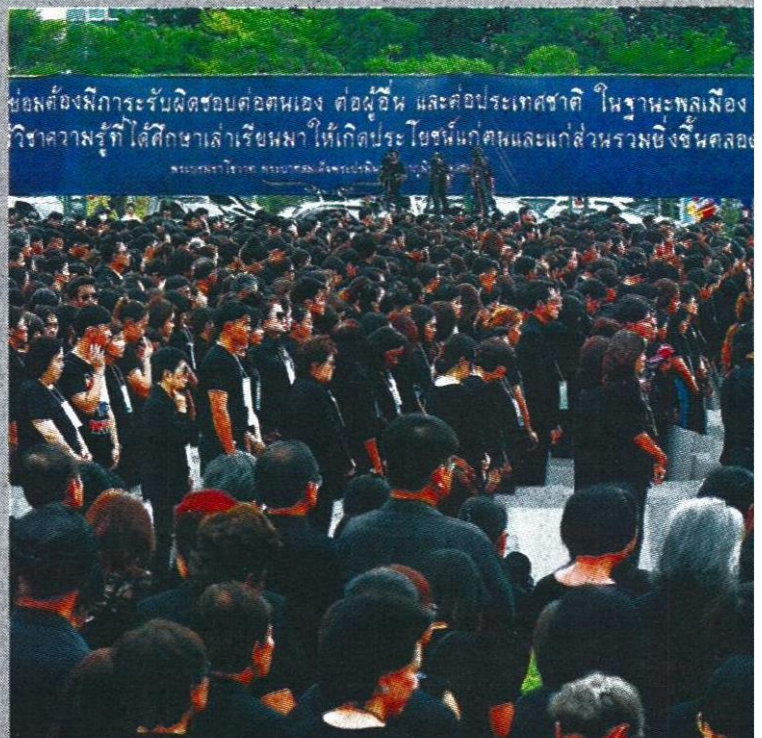
คณะศิษย์มหาวิทยาลัยธรรมศรัยยืนไว้อาลัยแด่พระบาทสมเด็จพระปรมินทรมหาภูมิพลอดุลยเดช