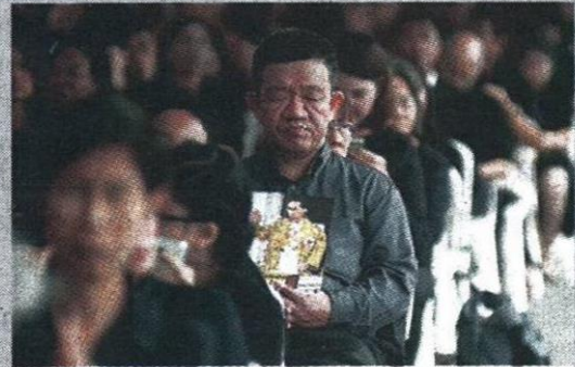
ประชาชนเข้าคิวรอลงนามแสดงความอาลัย ณ ศาลาสหทัยสมาคม ในพระบรมมหาราชวัง