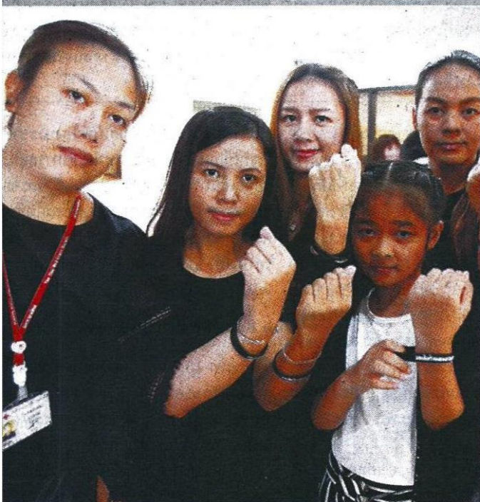
สภากาชาดไทย ได้รับสายรัดข้อมือสีดำ ซึ่งเขียนคำว่า "ขอเป็นข้ารองพระบาททุกชาติไป" จากนักธุรกิจชาวไต้หวัน เพื่อนำไปใช้ในกิจกรรมของสภากาชาดไทย