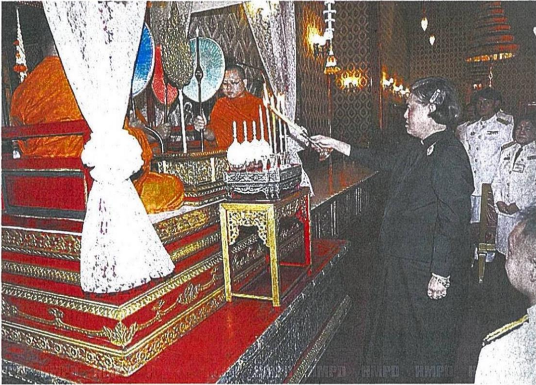
สมเด็จพระเทพรัตนราชสุดาฯ สยามบรมราชกุมารี ทรงจุดธูปเทียนเครื่องทองน้อยหน้าพระพิธีธรรมในพระราชพิธีบำเพ็ญพระราชกุศลสวดพระอภิธรรมพระบรมศพ พระบาทสมเด็จพระปรมินทรมหาภูมิพลอดุลยเดช ณ พระที่นั่งดุสิตฯ คำวันที่ 26 ต.ค.

แม่ค้าพ่อค้าส่วนใหญ่มักใช้วิธีคือให้ลูกค้าซื้อสินค้า โดยไม่มีเจ้าหน้าที่แม่แต่รายเดียวคอยตรวจตรา สร้างความรำคาญให้กับผู้ที่เข้ามาแสดงความอาลัยเป็นอย่างยิ่ง