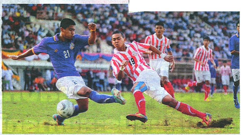
เกมการแข่งขันที่ทั้ง 4 สถาบันดวลกันสนุก ปีนีก็ยังคงสนุกเช่นเดิม

แข่งขัน โดยมีคอนเซ็ปต์งานที่มุ่งเน้นเรื่องความรัก ความสามัคคี ผ่านกิจกรรมต่างๆ ให้เหมือนกับครั้งแรกเริ่มในการจัดการแข่งขัน นอกเหนือจากฟุตบอลที่จะเปิดศึกลูกหนังบนพื้นสนามหญ้าของ