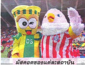
มาสคอตของแต่ละสถาบัน