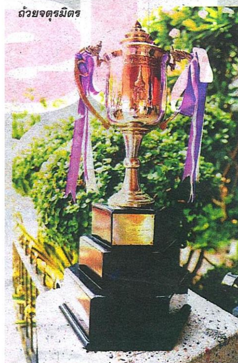
ถ้วยจตุรมิตร