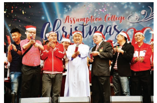
งานเอชคริสต์มาสแฟร์ 2017 (AC Christmas Fair 2017)