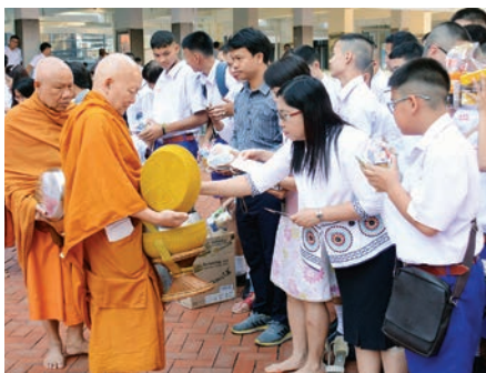
พิธีทำบุญตักบาตรข้าวสาร อาหารแห้งและกิจกรรมส่งเสริม คุณธรรมจริยธรรมวันศุกร์ต้นเดือน