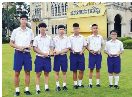
นักเรียนโรงเรียนอัสสัมชัญ ได้รับรางวัลเด็กและเยาวชนที่น่าชื่อเสียง มาสู่ประเทศชาติ ประจำปี 2561